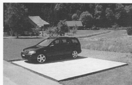
Pave Edge® starr für gerade Randabschlüsse