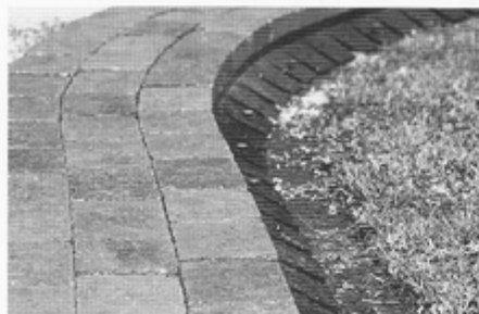
Pave Edge® flexlight für Kurven und Bögen