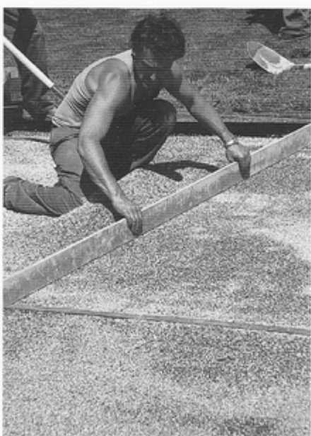
5. Nach Befestigung aller Pave Edge® wird das Bettungsmaterial aus Sand aufgetragen und abgezogen.