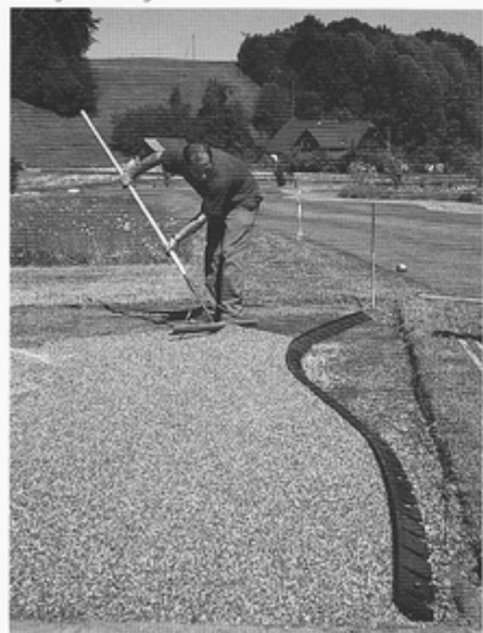
2. Randausbildungen in Form von Kurven und Bögen sind mit Pave Edge® flexlight vorgenommen.