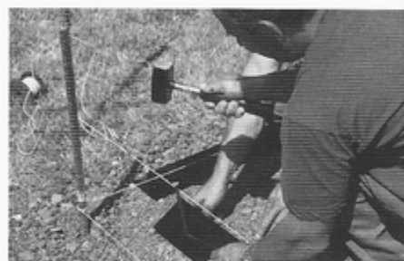
1. Die Pave Edge® werden auf der verdichteten Tragschicht entsprechend der vorgesehenen Randabschlüsse gelegt und mit Erdnägeln befestigt.