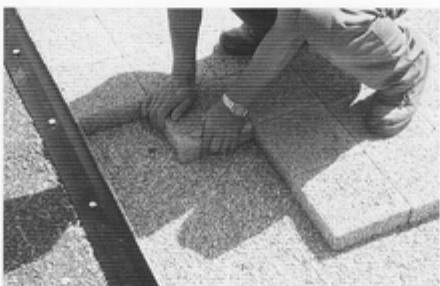
6. Auf der Bettung werden dann die Platten in üblicher Weise verlegt und verfugt.

Die Gestaltung von Flächen mit Platten der Stein-systeme Vineta, Lavania, Trojana und Bizantina ist bei der Verlegung im Sandbett immer mit einer guten Randeinfassung vorzubereiten. Ideal für alle Flächen ist dazu Pave Edge® geeignet. Mit der fertigen Randschiene Pave Edge® können Weg-, Terrassen- und Zufahrtflächen schnell und sicher befestigt werden, ohne dass anbetoniert werden muss. Das spart Geld und Zeit: Pave Edge® wird einfach mit Nägeln im Untergrund fixiert. Die einzufassende Fläche kann ohne Wartezeit weiter bearbeitet werden und ist sofort belastbar.