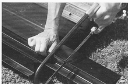
3. Bei Bedarf wird Pave Edge® mit einer Säge auf die erforderliche Länge zugeschnitten.