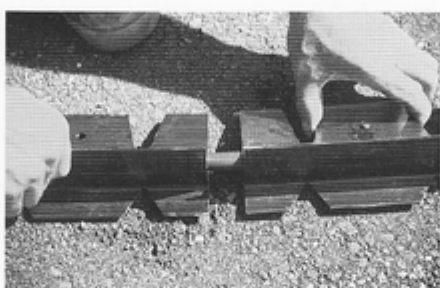
4. Mit Hilfe der mitgelieferten Verbindungsstäbe werden die Pave Edge® an den Stößen problemlos aneinander gefügt.